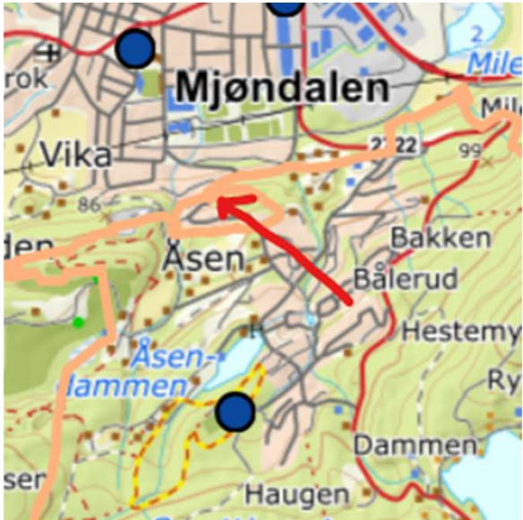
Valgfrie områder mellom Åsen og Mjøndalen