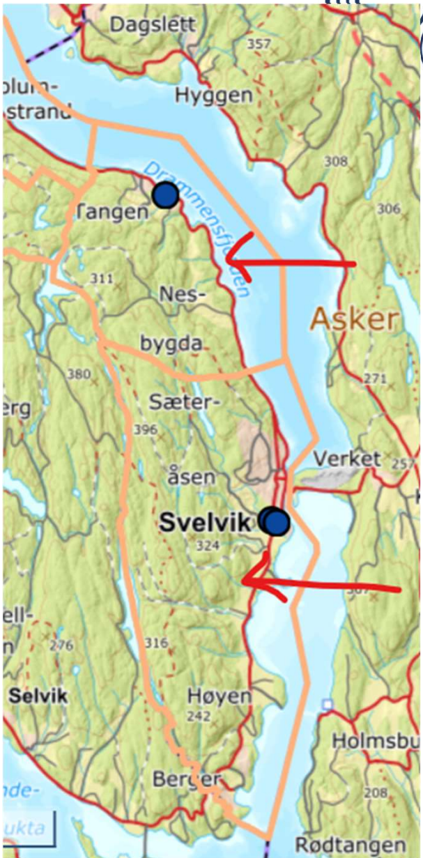
Valgfrie områder mellom Tangen og Tømmersås