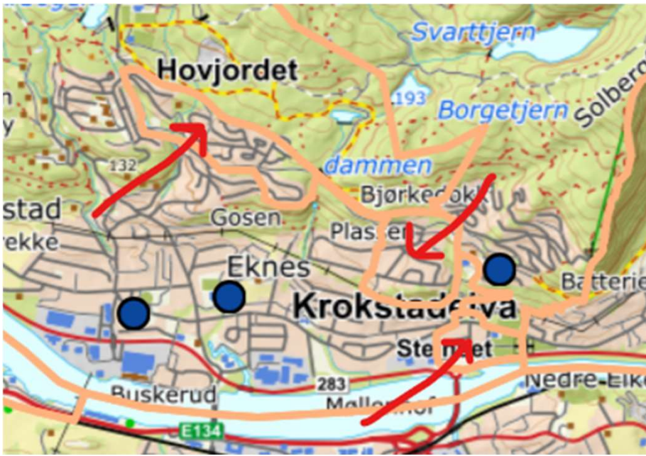
Valgfrie områder mellom Stenseth og Krokstad