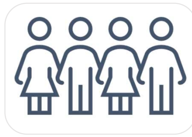
Et tverretatlig team