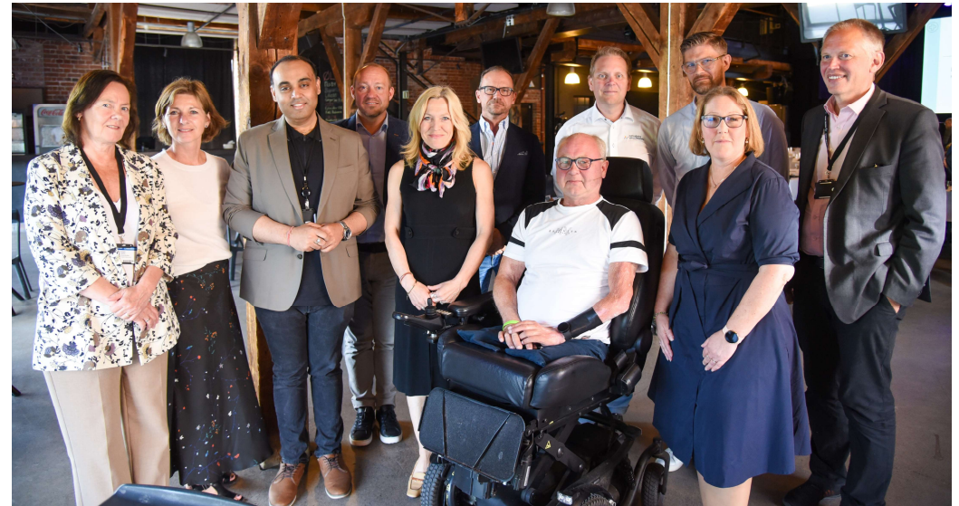
Fra strategisk samarbeidsutvalg Vestre Viken og kommunene i opptaksområdet