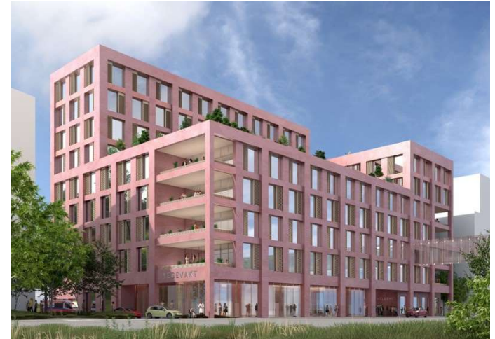
Aktuelt bygg i Drammen Helsepark - Spinneriet