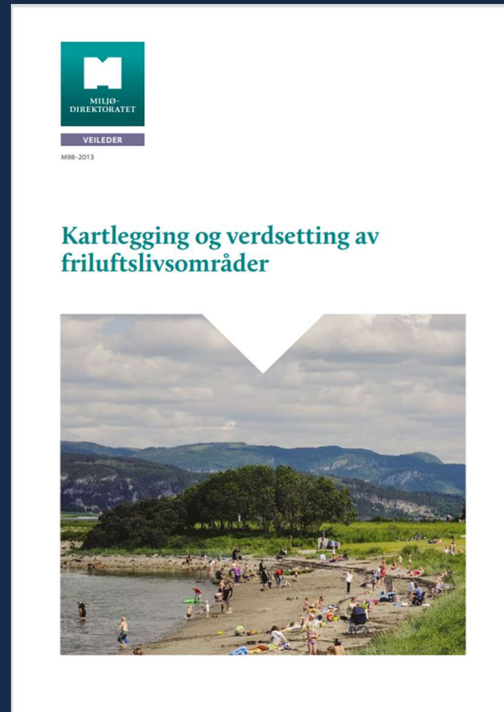
Forsiden på veileder for Kartlegging og verdsetting av friluftslivsområder

Målet er at alle norske kommuner skulle ha kartlagt og verdsatt sine friluftslivsområder