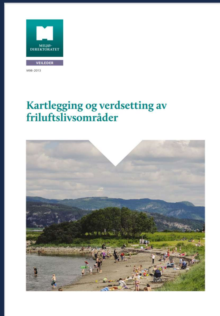
Forsiden på veileder for Kartlegging og verdsetting av friluftslivsområder

Målet er at alle norske kommuner skulle ha kartlagt og verdsatt sine friluftslivsområder