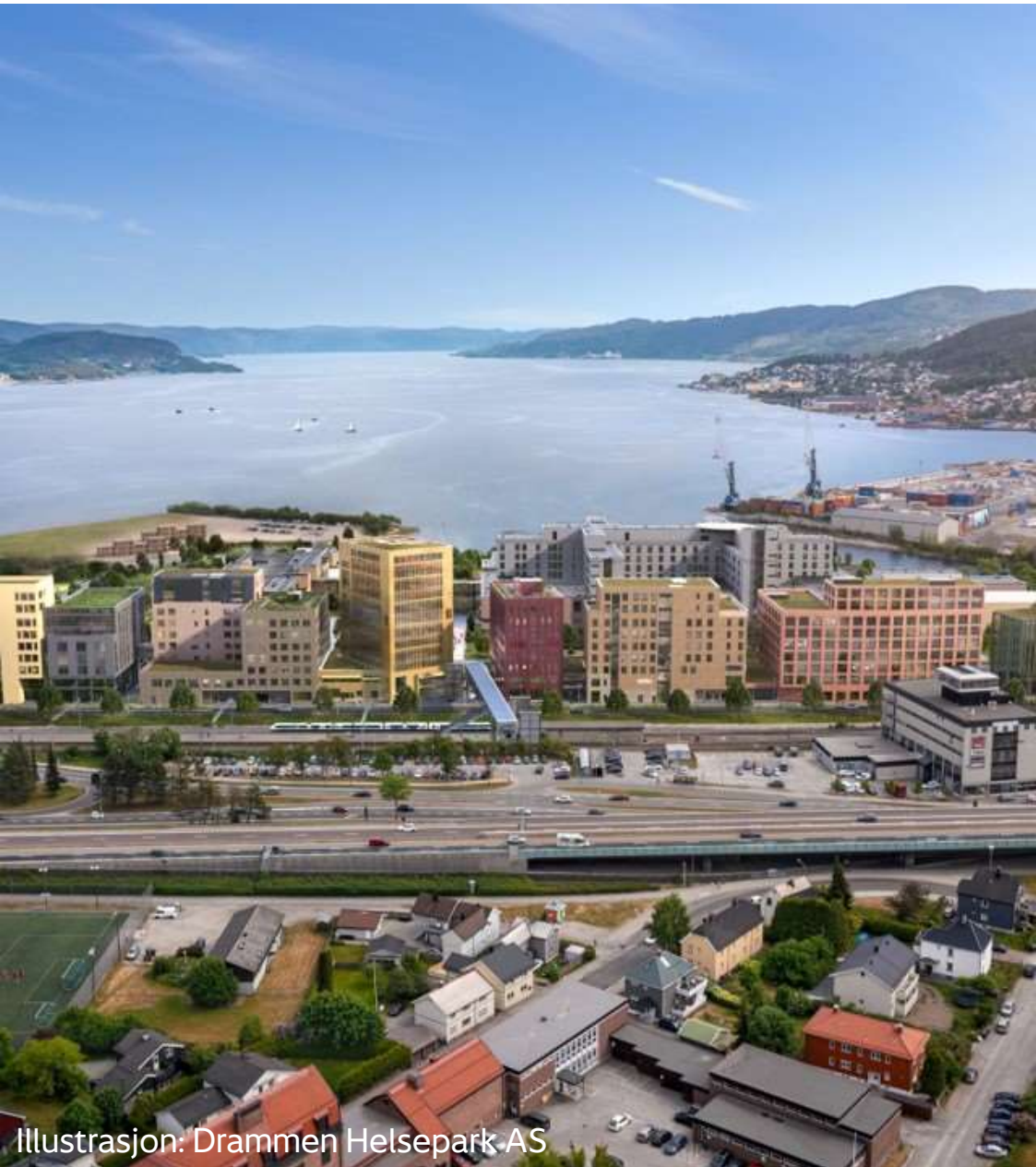
Illustrasjon: Drammen Helsepark AS