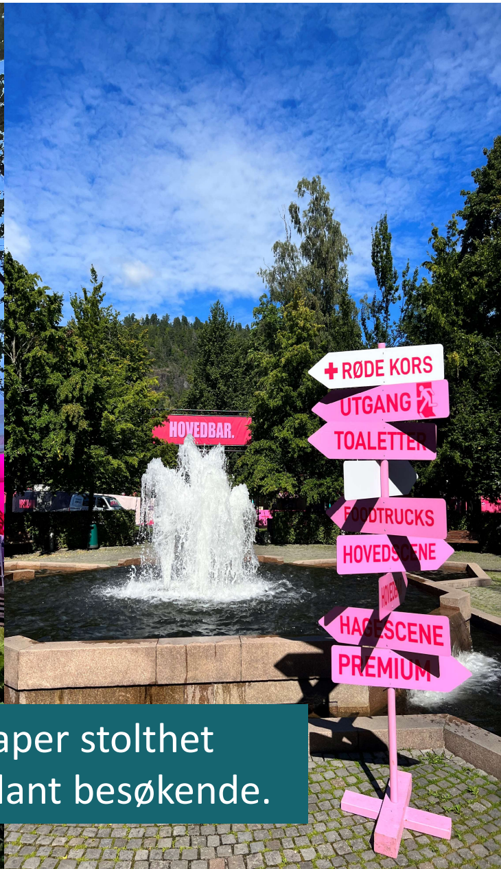
Et av Norges flotteste festivalområder skaper stolthet blant innbyggere og bygger omdømme blant besøkende.