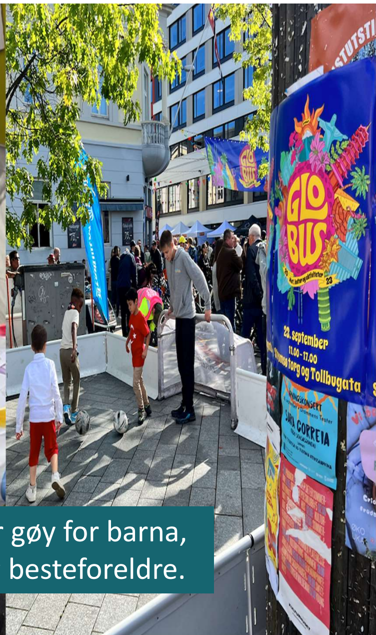
Aktiviteter og gateleker fra hele verden er gøy for barna, og der barna vil være er deres foreldre og besteforeldre.