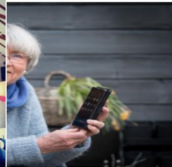
...er vertskap sammen med elderrådet i Bærum når de setter i gang et digitalt møte om framtidens hoformer for eldre.