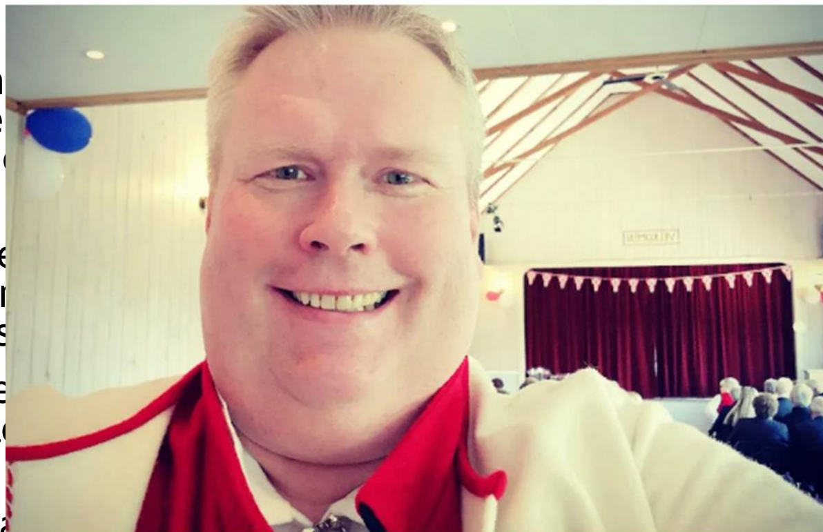
Arne Torget. Arkivfoto